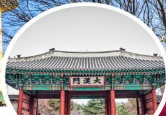
พระราชวังต็อกซูกุง