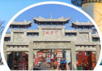
โซน่าทาวน์