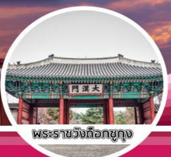
พระราชวังต็อกซูกุง