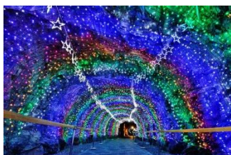
การจัดแสดงดนตรีและศิลปะอีกด้วย

มีร้านขายของประเภทต่างๆ ที่มาจากเมืองจีน เป็นย่านที่มีร้านอาหารที่มีกลิ่นอายความเป็นจีนอยู่มากที่สุด แล้วย่านนี้ยังเป็นไชน่าทาวน์เพียงแห่งเดียวในเกาหลีด้วย จากนั้นนำชม พิพิธภัณฑ์ถ้ำวังเมียง (Gwangmyeong Cave) ในอดีตคือเหมืองถ่านหิน ตั้งแต่สมัยยุคอาณานิคมญี่ปุ่น เป็นสถานที่สำคัญแห่งหนึ่งทางประวัติศาสตร์ของประเทศเกาหลี ตั้งอยู่ที่จังหวัดคยองกึโด กำเนิดขึ้นในปี 1912 ก่อนจะถูกทิ้งร้างในปี 1972 ปัจจุบันได้กลายเป็นสถานที่ท่องเที่ยวแห่งใหม่ภายในถ้ำมีจัดแสดงโลกใต้น้ำ Cave Aqua World ให้ได้ชม และมีห้องโถงใน