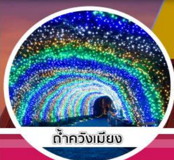
ต้าควังเมียง