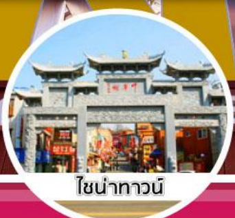
โซนัททาวน์